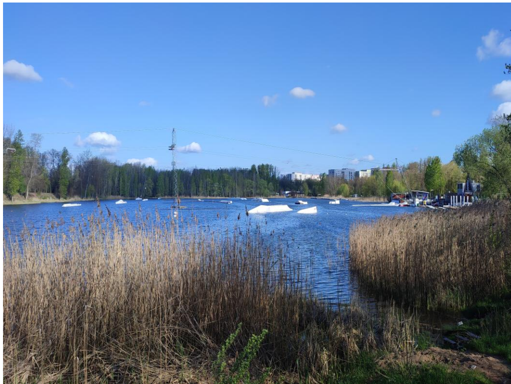
Kompleks stawów – Stawiki w Sosnowcu – miejsce do wypoczynku, rekreacji i sportu