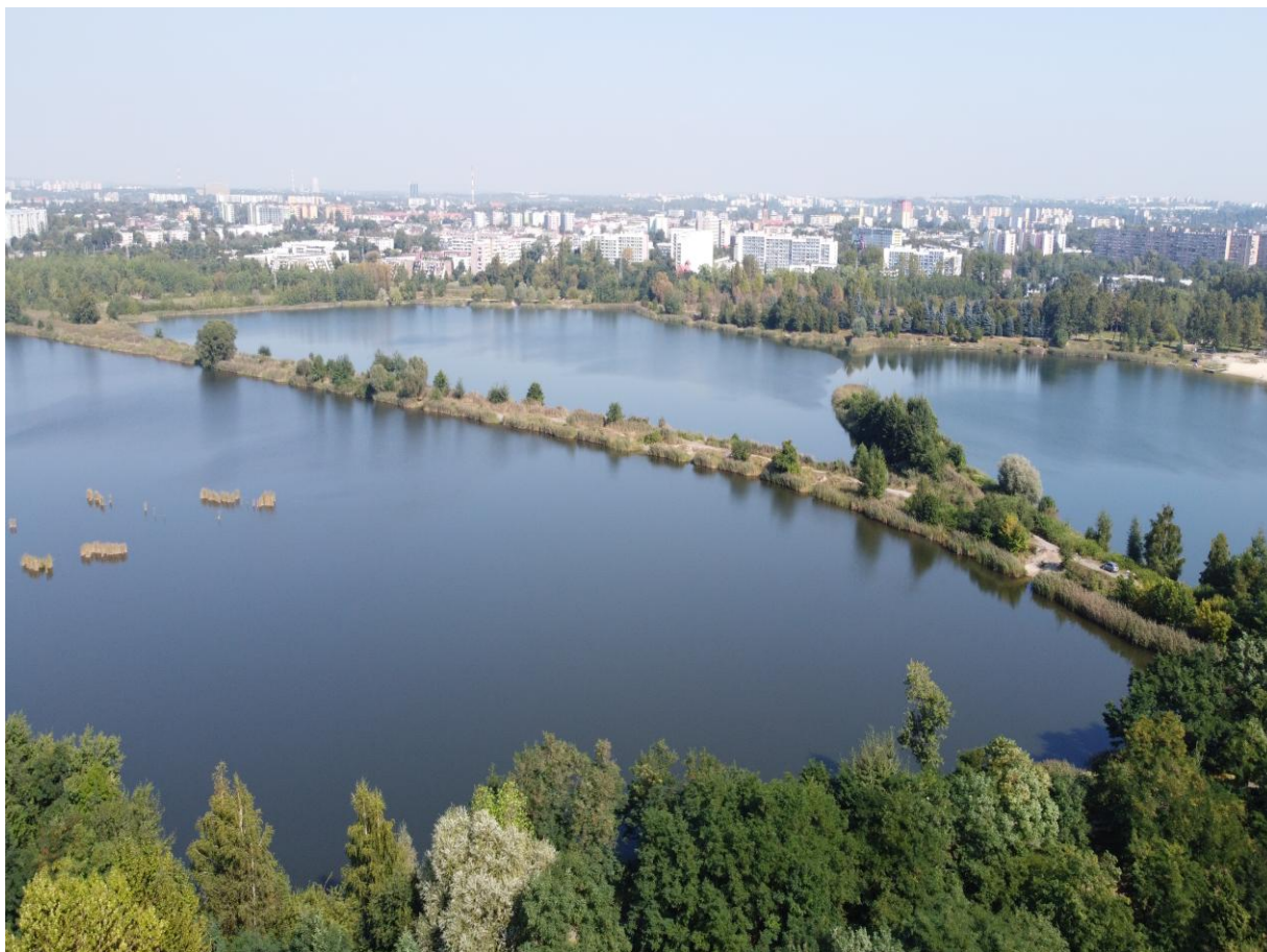
Widok z lotu ptaka na zespół stawów z groblą. Na drugim planie zabudowa osieli mieszkaniowych Sosnowca