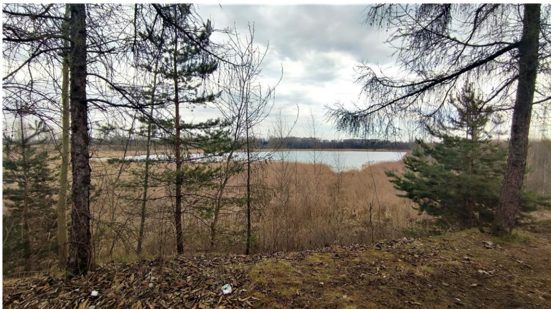
Widok na staw Hubertus IV.