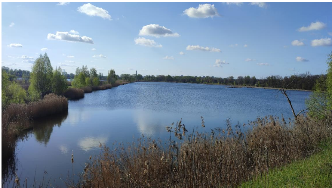
Staw Hubertus II. Półnaturalnie zarośnięte brzegi